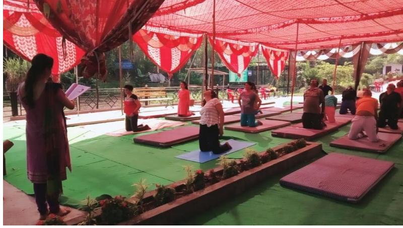
(योग करते हुए छात्र-छात्राओं के छायाचित्र)

दिनांक 20 जून 2018 एवं 21 जून 2018 को अन्तर्राष्ट्रीय योग दिवस के अवसर पर उत्तराखण्ड मुक्त विश्वविद्यालय के अध्ययन केन्द्र जानकी देवी एजुकेशन वैलफियर सोसाइटी में दो दिवसीय योग शिविर का आयोजन किया गया जिसमें परिसर निदेशक देहरादून द्वारा प्रतिभाग किया गया। इस अवसर पर निदेशक, परिसर देहरादून द्वारा योग विषय पर वक्तव्य दिया गया ।