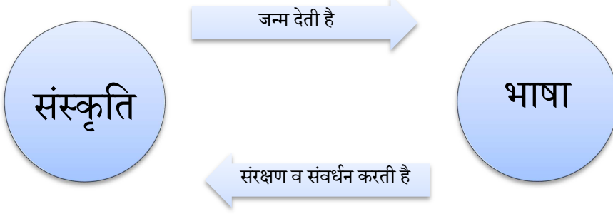
चित्र 4: भाषा और संस्कृति की अन्योन्याश्रिता

इस प्रकार यदि हम बहुभाषावाद की बात करते हैं तो बहुसंस्कृतिवाद से हम अलग नहीं हो सकते हैं। किसी भी संस्कृति को समझने के लिए उस संस्कृति विशेष की भाषा को समझना ही पड़ेगा क्योंकि भाषा किसी भी संस्कृति का एक विशेष और अनिवार्य अंग है। बच्चे बहुत सी अलग अलग तरह की भाषाओं के साथ विद्यालय में आते हैं और उनकी इन भाषाओं से जुड़ी अलग-अलग संस्कृतियां भी होती हैं। और हम यह भी जानते हैं कि बच्चा (व्यक्ति) अपनी संस्कृति विशेष का ही उत्पाद होता है। उसको समझने के लिए उसकी संस्कृति को समझना अनिवार्य है और संस्कृति समझने की प्रथम शर्त भाषा को समझना है। इसको समझने की विधियों की चर्चा हम इस इकाई के अंतिम भाग में करेंगे। अभी हम भाषाई विभिन्नता की मौजूदगी पर चर्चा करते हैं।