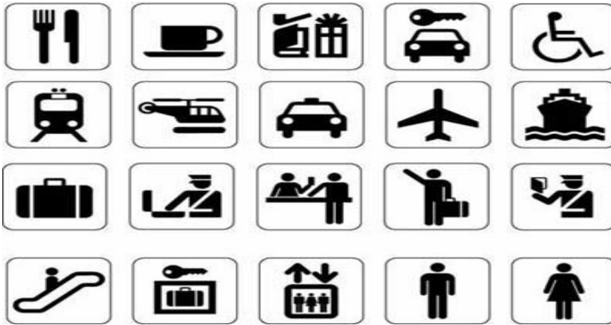
चित्र 3: आधुनिक चित्र संप्रेषण चिन्ह

जो चर्चा हमें बाद में करनी चाहिए थी वह अभी करना जरूरी हो रहा है। बात यह है कि चित्र के माध्यम से संप्रेषण लिपि के विकास की शुरुआत तो है पर शुद्ध लिपि के विकास के बाद भी हमने चित्र पद्धति का प्रयोग बंद नहीं किया है। आज भी राष्ट्रीय राजमार्गों पर सार्वजनिक स्थलों जैसे कि रेलवे स्टेशन, विमानपत्तन पर चित्र के माध्यम से संप्रेषण किया जाता है(चित्र 3)। इसका कारण है कि चित्रों के माध्यम से संप्रेषण में भ्रम की सम्भावना कम से कम होती है।