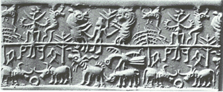
चित्र 2: हणप्पा सभ्यता की चित्र लिपि

जो चर्चा हमें बाद में करनी चाहिए थी वह अभी करना जरूरी हो रहा है। बात यह है कि चित्र के माध्यम से संप्रेषण लिपि के विकास की शुरुआत तो है पर शुद्ध लिपि के विकास के बाद भी हमने चित्र पद्धति का प्रयोग बंद नहीं किया है। आज भी राष्ट्रीय राजमार्गों पर सार्वजनिक स्थलों जैसे कि रेलवे स्टेशन, विमानपत्तन पर चित्र के माध्यम से संप्रेषण किया जाता है(चित्र 3)। इसका कारण है कि चित्रों के माध्यम से संप्रेषण में भ्रम की सम्भावना कम से कम होती है।