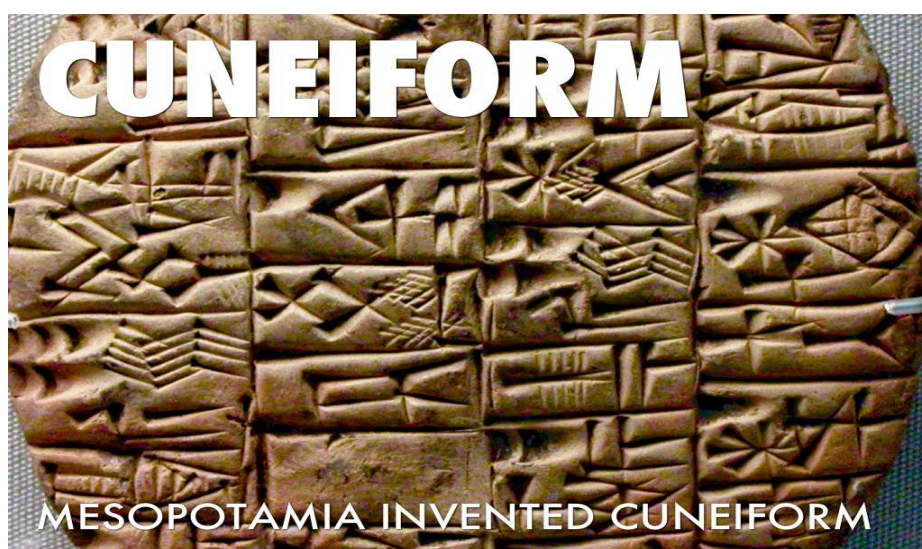
चित्र 1: मेंसोपोटामिया की कीलाक्षर लिपि (चित्र श्रोत:

विश्व की सभ्यताओं के इतिहास में हम देखते हैं कि सर्वप्रथम लगभग पाँच हजार वर्ष पूर्व मेंसोपोटामिया की सभ्यता के शहर सुमेर (वर्तमान ईरान इराक वाला क्षेत्र) में कीलक्षर/कीलाकार लिपि का विकास हुआ था। यह लिपि मिट्टी के फलकों पर उत्कीर्ण की जाती थी(चित्र 1)। इस लिपि में चित्रात्मक व रेखात्मक दोनों ही प्रकार के चिन्हों का प्रयोग किया जाता था।