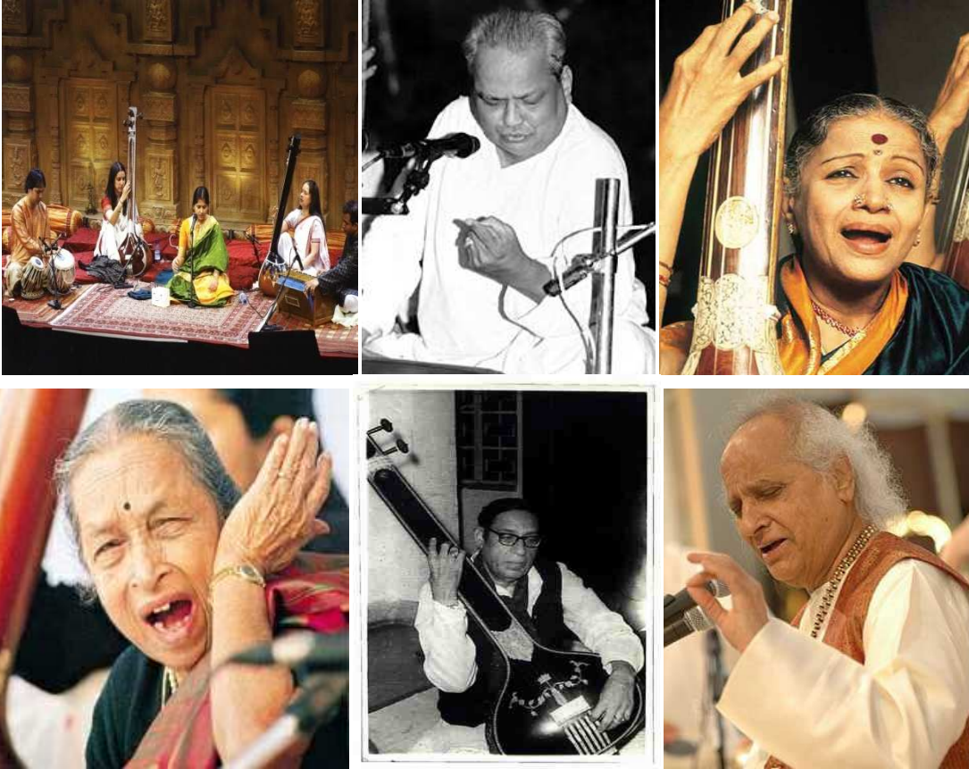
गायन-रागों और तालों का अध्ययनI (एम0पी0ए0एम0वी0-502)-प्रथम सेमेस्टर

उत्तराखण्ड मुक्त विश्वविद्यालय, हल्द्वानी